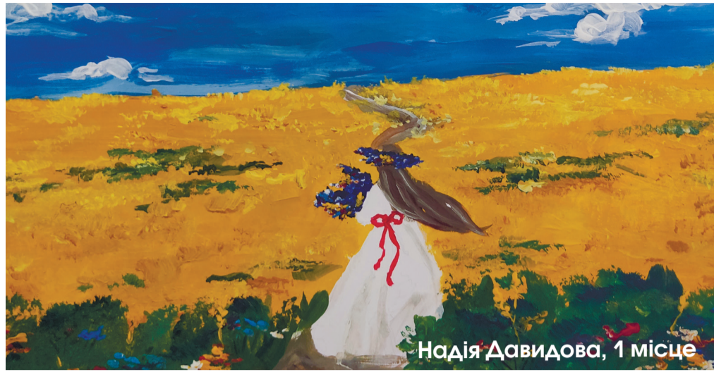
Надія Давидова, 1 місце