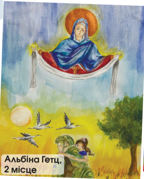
Альбіна Гетц, 2 місце