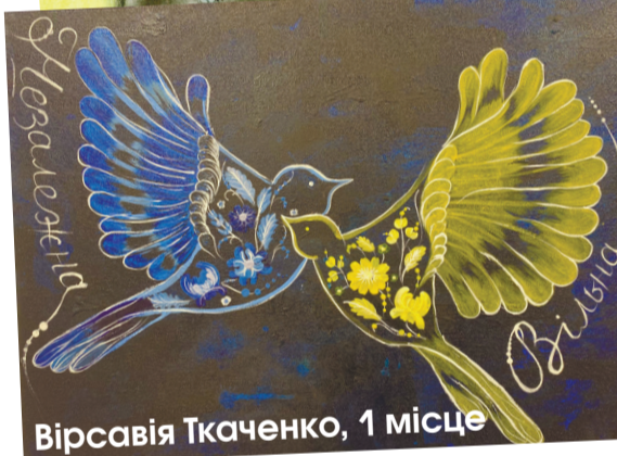
Вірсавія Ткаченко, 1 місце

Найбільшу кількість вподобайок під час глядацького голосування онлайн збирила робота учениці Балівського ліцею Крістини Жилиак .