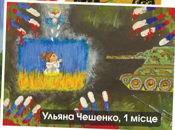
Ульяна Чешенко, 1 місце