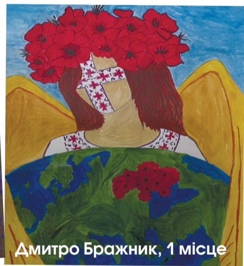
Дмитро Бражник, 1 місце